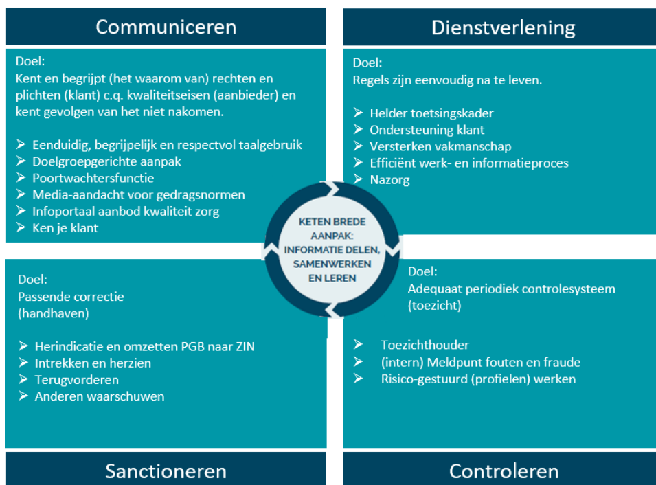
Figuur 4: De cirkel van naleving bij fraude door inwoners

Het is van groot belang dat er onderscheid wordt gemaakt tussen de mate van verwijtbaarheid van inwoners die hebben gefraudeerd. Er is verschil in het maken van onbedoelde fouten en het plegen van opzettelijke fraude. De Wetenschappelijke Raad (2017) voor het regeringsbeleid onderschrijft in haar rapport: ‘Weten is nog geen doen’, dat de zelfredzaamheid van inwoners vaak wordt overschat. Het is belangrijk om hier aandacht voor te hebben en om een menselijke maat te hanteren bij het sanctioneren van fraude.