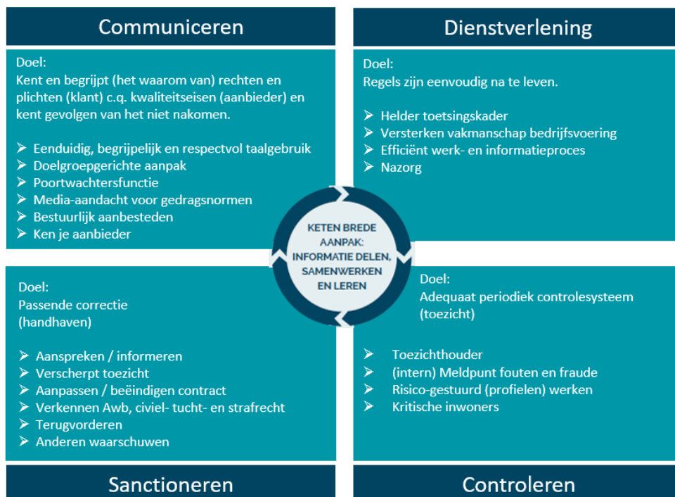
Figuur 3: De cirkel van naleving bij fraude door zorgaanbieders

Regionaal (toezicht op Wmo-aanbieders) kan binnen alle vormen van kwaliteits- en rechtmatigheidstoezicht besloten worden tot het inzetten van een maatregel. Daar waar de veiligheid van de cliënt in het gedrang is, kan besloten worden tot het instellen van een cliëntenstop, of zelfs het overplaatsen van cliënten naar een andere aanbieder waar de veiligheid wel gegarandeerd kan worden. het belang van de kwetsbare cliënten wordt bij deze besluiten voorop gesteld en hierin wordt altijd een zorgvuldige afweging gemaakt in samenspraak met de betrokken gemeente(n).