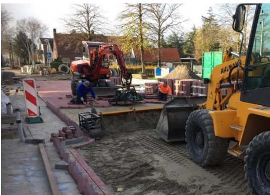
Afbeelding: bestratingswerkzaamheden Van Wijkstraat.

Als de bestrating van de school tot en met de kruising van de Populierenstraat aangebracht is, starten we met de rioleringswerkzaamheden richting de Zandse Kerk.