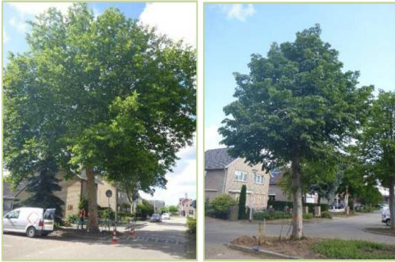
Afbeelding: De plataan en kastanjeboom bij de Zandse Kerk.

De bomen in de groenstrook voor de woningen van huisnummers 20 t/m 22 worden wel gekapt.