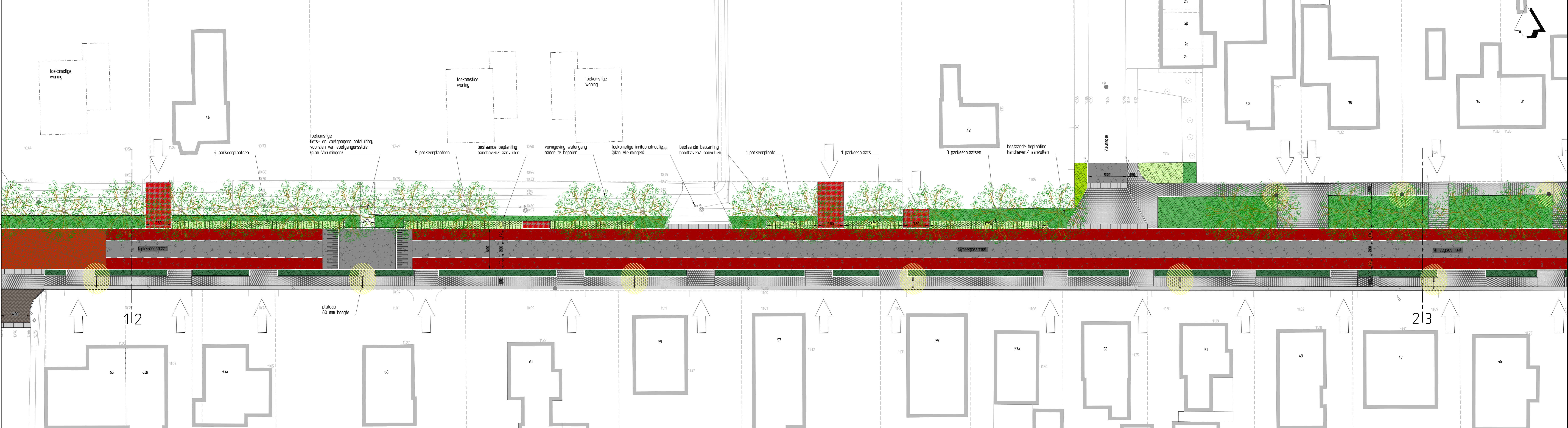
Overzichtstekening (schaal 1 : 5000)